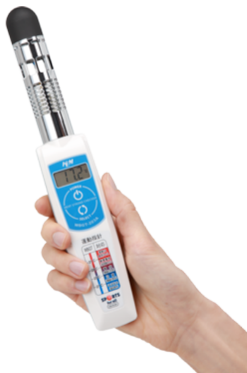
写真 WBGT 計