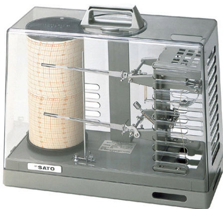
写真 自記式温度計