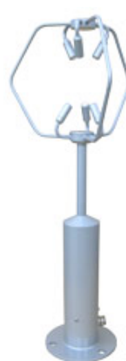
写真 超音波風速計*2