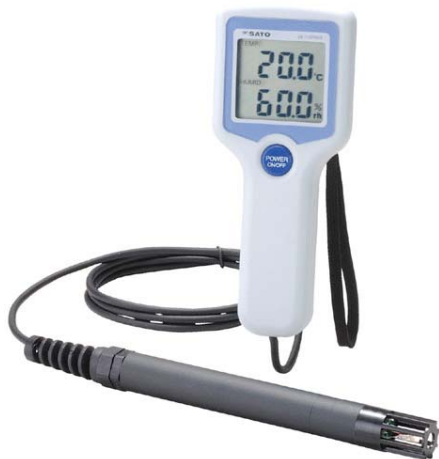
写真 デジタル温湿度計*2