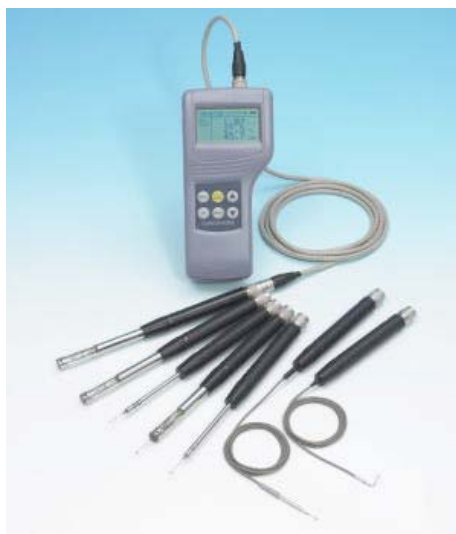
写真 熱線式風速計