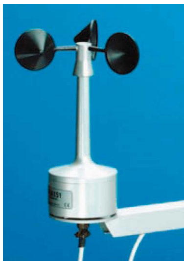
写真 三杯式風速計