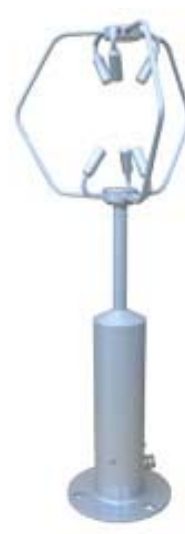
写真 超音波風速計 (出典: ソニックの HP)