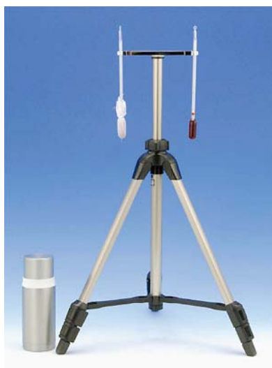
写真 カタ寒暖計