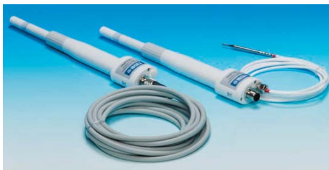
写真 湿度温度プローブ*1