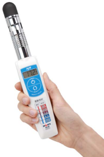
写真 WBGT 計