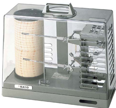
写真 自記式温度計

アスマン通風乾湿温度計は、ドイツの気象学者 R. Assmann が 1887 年に考案した。湿球温度計の示度は、感温部が水の蒸発により冷やされて乾球温度計の示度よりも低くなる。これらの差を用いて相対湿度を計算する (JIS の表、もしくは Sprung (スプリング) の公式を用いる)。